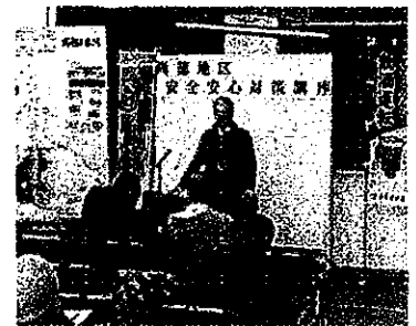
交通安全講習の実施状況